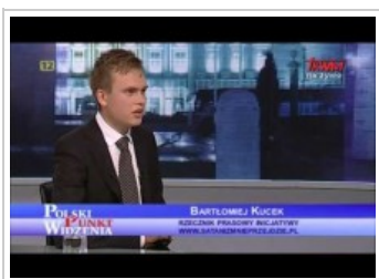
Akacja "Satanizm nie przejdzie"