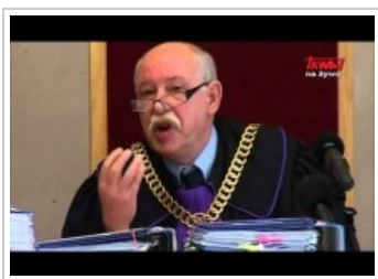
Kasacja do Naczelnego Sądu Administracyjnego w sprawie TV TRWAM