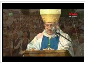
Homilia wygłoszona podczas zakończenia peregrynacji kopii obrazu Matki Bożej Częstochowskiej w diecezji elbląskiej