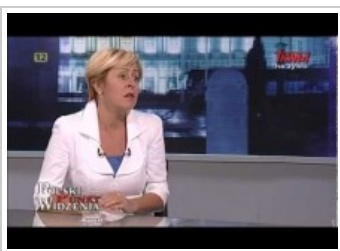
Oświata w Polsce