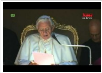
Środowa Audycja Generalna