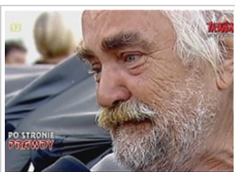
Protest przeciwko polityce mieszkaniowej Gdańska