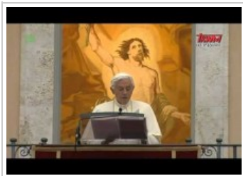
Aniół Pański z Ojcem Świętym Benedyktem XVI