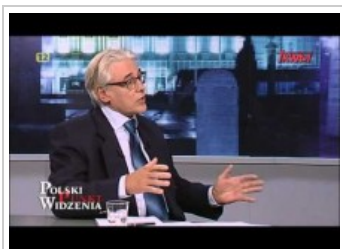
Kolejna niewyjaśniona afera?

Ekspert dodał, że propozycje PiS będą mocno kontrastować z tym, co przedstawi premier Donald Tusk, w spodziewanym na jesień nowym „expose”.