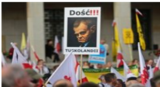
Marsz "Obudź się Polsko!"

Przynieśli ze sobą biało-czerwone flagi i transparenty. Na jednym z banerów widnieją twarze premiera i członków rządu a pod nimi napis "Totalna cenzura naszym orężem". Na innych można przeczytać: "Dość liberałów i lewactwa", "Odzyskajmy Polskę dla Polaków" i "Dość dyskryminacji katolickich mediów".