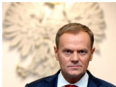
Donald Tusk

Trzy czwarte Polaków źle ocenia działalność rządu, a niewiele mniej pracę premiera Donalda Tuska. Za to co drugi pozytywnie wypowiada się o prezydencie - wynika z najnowszego sondażu TNS Polska.