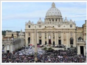
Aniół Pański z Ojcem Świętym Benedyktem XVI

poświęconego w pamiętnym Grudniu 1980 r., robotnicy, stoczniowcy i portowcy, autorzy i projektanci tego narodowego symbolu i pamięci przestrzegamy wszystkich, którzy sięgają po narodowe świętości, słowami utrwalonymi na Pomniku: ...nie bądź bezpieczny, poeta pamięta, możesz go zabić, narodzi się nowy, spisane będą czyny i rozmowy...”.